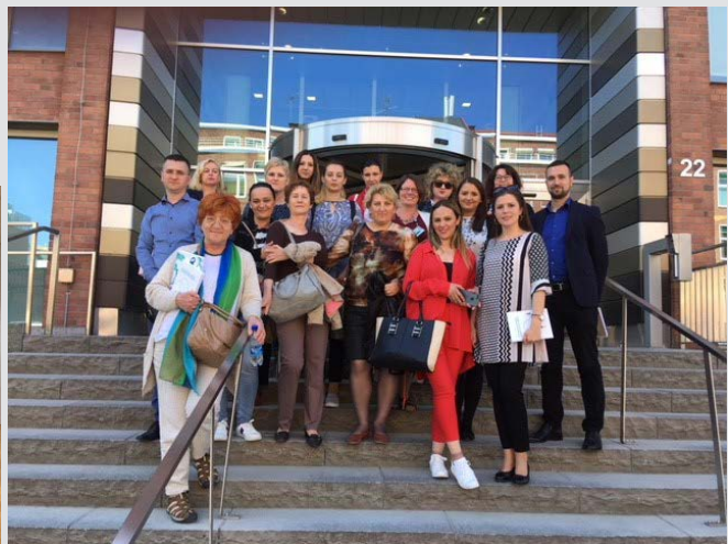
Timovi za Pružanje usluga poreznim obveznicima posjetili su Stockholm u maju. Timovi su između ostalog razgovarali o Call centru i servisnim uredima.