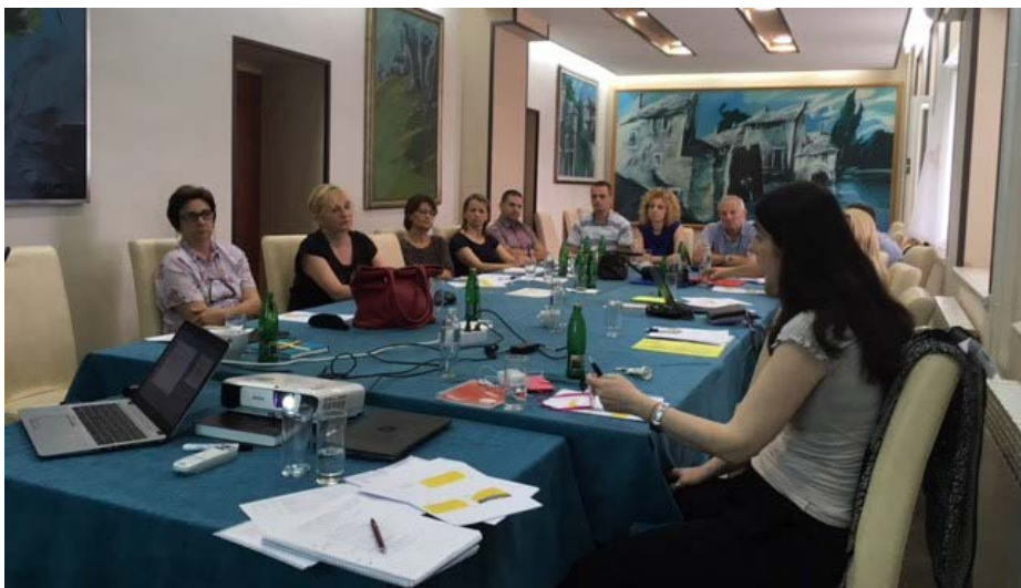
Dio tima za predisunjavanje u Trebinju.