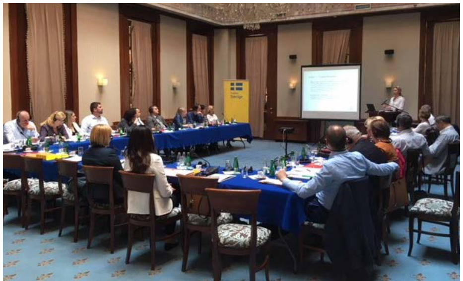
Dvodnevni seminar u aprilu o BEPS-u i međunarodnoj razmjeni informacija.

Upravljanje projektom bilo je glatko i jednostavno, a voditelji projekta iz STA i BiH su se svaka 3-4 mjeseca neformalno sastajali kako bi razgovarali, dali povratne informacije i procijenili aktivnosti.