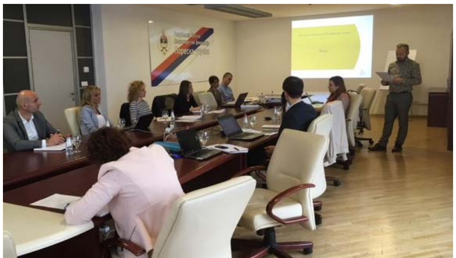
Diskusije u Poreznoj upravi RS u aprilu o pilot projektima za predisunjavanje poreznih prijava.

Šef odjela za analizu i upravljanje rizicima, Uprava za indirektno oporezivanje Bosne i Hercegovine