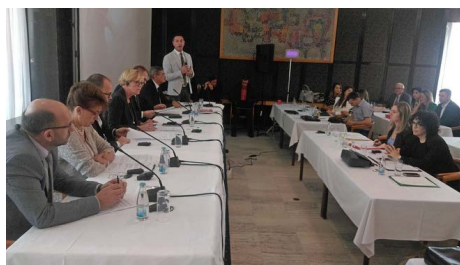
Razgovori tokom panel sesije.