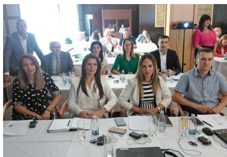
Neki od učesnika iz PURS.