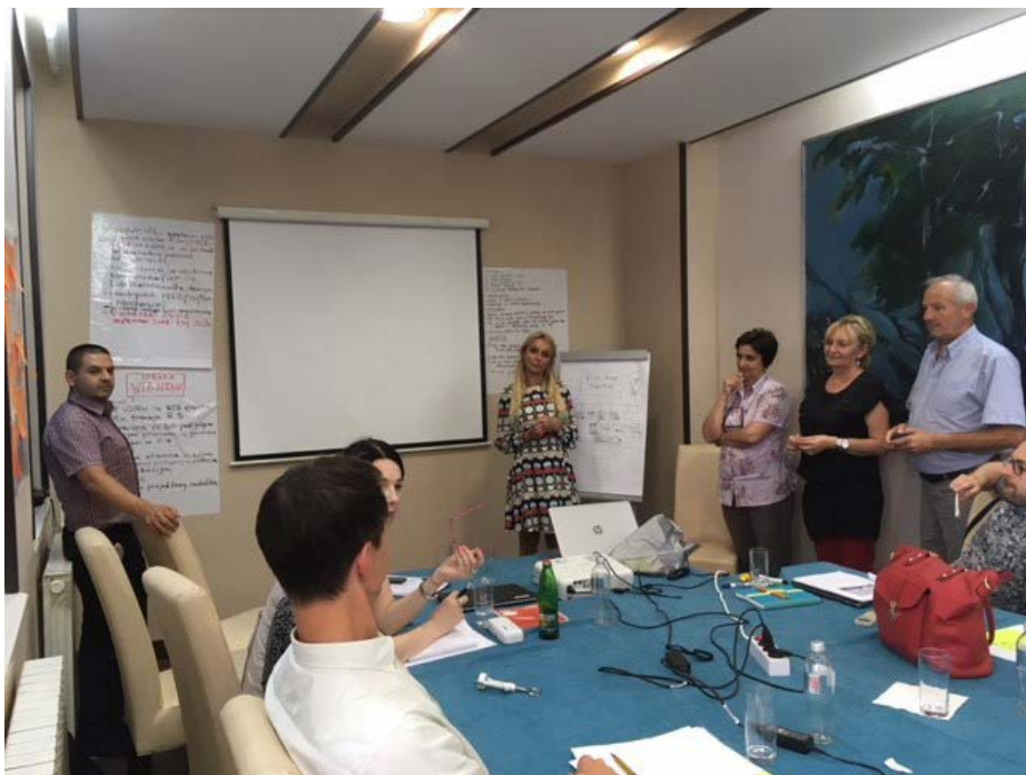
Prezentacije tokom ekspertne misije u Trebinju.

Tekst napisao: G-din Alem Resulović Kratkoročni ekspert, STA