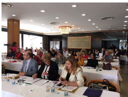
Svi učesnici su se okupili za novu prezentaciju.