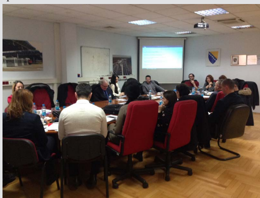
Timovi za Promjenu načina razmišljanja tokom njihove misije u martu u UINO u Banja Luci.